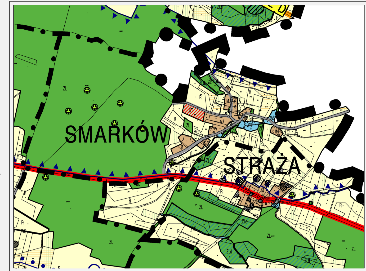
Wyrys ze SUIKZP miasta i gminy Wołów