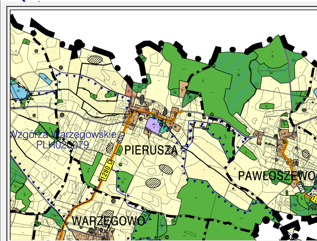
Wyrys ze SUIKZP miasta i gminy Wołów