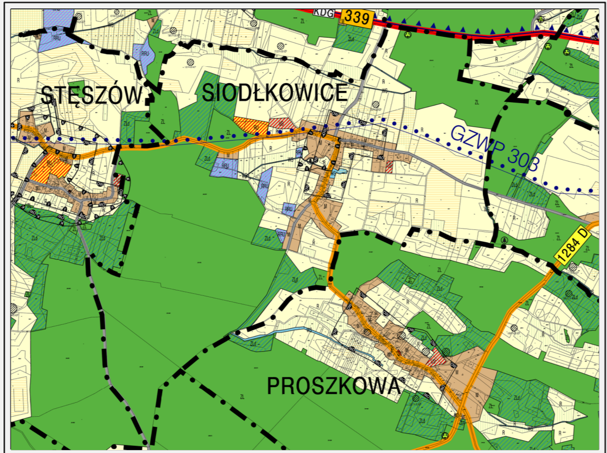
Wyrrys ze SUIKZP miasta i gminy Wołów