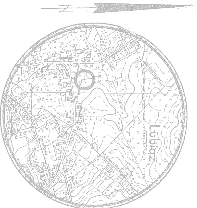
Szkic orientacyjny w skali 1:10000

STAROSTA WOJOWSKI Wydział Geodezji, Kartografii, Miernictwa i Rozpoznania Powierzchni i Budownictwa Biuro Rejonowe Geodezji, Kartografii i Rozpoznania Powierzchni i Budownictwa ul. Wolności 10, 56-100 Wołów 03 WRZ 2012